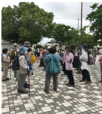
緑が丘駅 集合場所

雄岡山は明石の地名の元となった雄岡神の赤い石伝説の山であり、頂上からは明石海峡大橋や淡路島、西神中央工業団地などを一望しながらしばしの水分補給と休憩を取った。