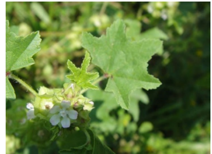
ウサギアオイの花