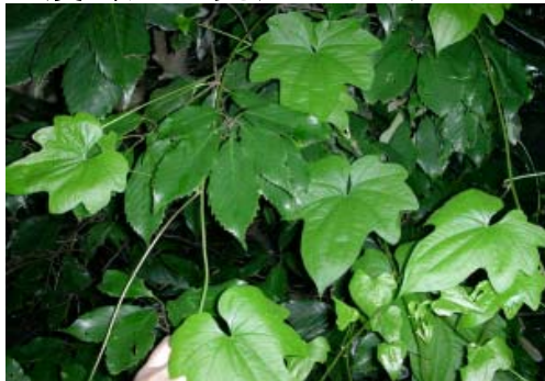
△(翼/欲?のある)イノモトソウ*