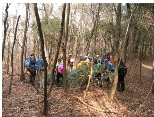
ミヤマシキミの説明